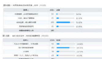
迎新介绍 // 调查结果报告